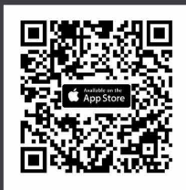
ดาวน์โหลด Application IR PLUS AM ระบบ iOS 14.5 ขึ้นไป

ในวันประชุม ผู้ถือหุ้นเข้าสู่ Application IR PLUS AGM และกรอกรหัส Pincode เพื่อลงทะเบียนเข้าร่วมประชุม