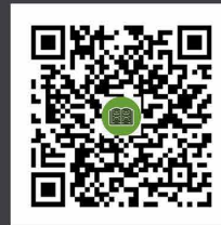
คู่มือผู้ใช้งาน s:UU IR PLUS AGM TH และ ENG