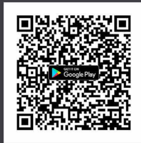
ดาวน์โหลด Application IR PLUS AM ระบบ Android Ver.8 ขึ้นไป